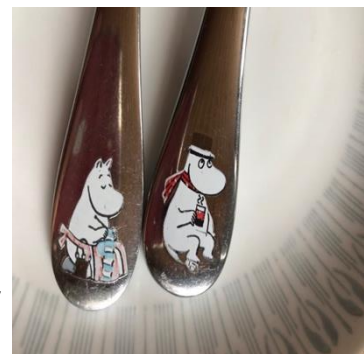
Abbildung 3: Cartoon-Figuren "Moomins"

Auf der Suche nach meiner Frage, warum Finnland auch dieses Jahr zum glücklichsten Land der Welt gewählt wurde, bin ich auf die einzigartigen Traditionen gestoßen. Von den berühmten Saunen bis hin zu den beliebten Cartoon-Figuren "Moomins", die in jedem Haushalt zu finden sind. Die Finnen haben eine Große Vorliebe für Kaffee, Lakritze und Glücksspiele wie beispielweise Bingo, welches auch auf großen Kreuzschiffen gespielt wird, denn das gehört zu den beliebten Freizeit Aktivitäten am Wochenende.