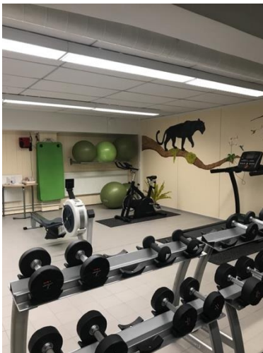
Abbildung 2: Fitnessraum der Schule