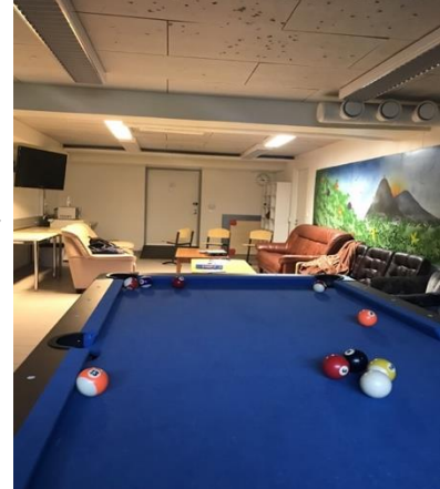
Abbildung 1: Billardzimmer in der Schule