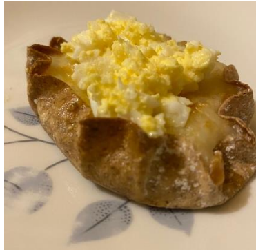
Abbildung 4: Karjalanpiirakka Ein Gericht, das aus einer dünnen Roggenmehlkruste besteht, das gefüllt ist mit Reis und Milch. Die Füllung wird oft mit Eiern oder Butter belegt.

Seetang, sowie Orangenschalen besteht. Es hat eine cremige Konsistenz. Einige weiteren traditionellen Gerichte, die ich versuchen durfte, sind: