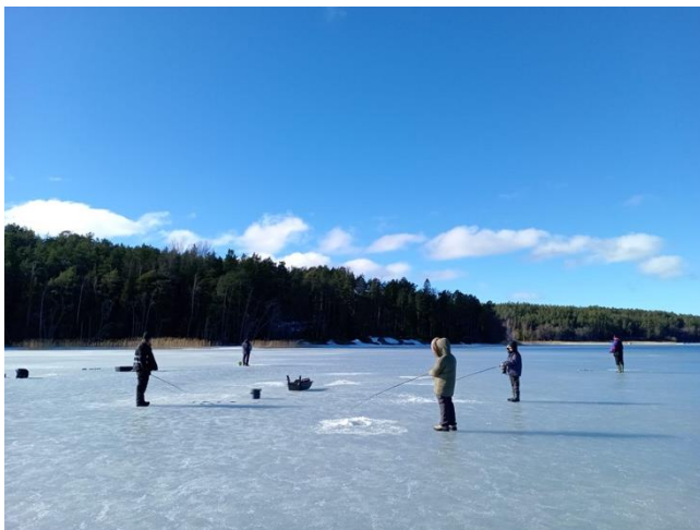
Abbildung 7: Jägerin & Sammlerin

Geschichte und Traditionen Finnlands gegeben.