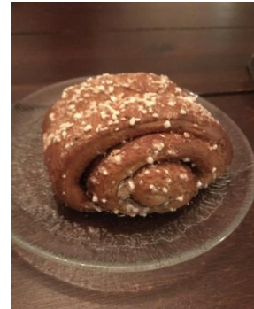
Abbildung 5: Korvapuusti: Das ist eine typisch finnische Zimtschnecke, die mit Kaffee gerne gegessen wird.